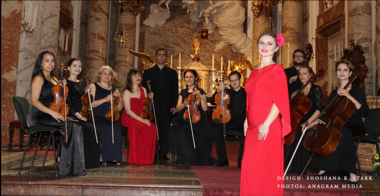
DESIGN: SHOSHANA R. STARK

EVERY TUESDAY JEDEN DIENSTAG AT 8:15PM/UM 20:15 JUNE - OCTOBER 2018